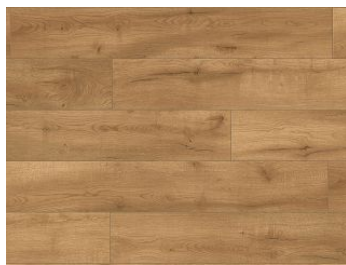
Panel podłogowy wodoodporny Butterscotch Dąb Z209